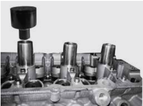
封堵管路内壁 Internal to sealed pipes