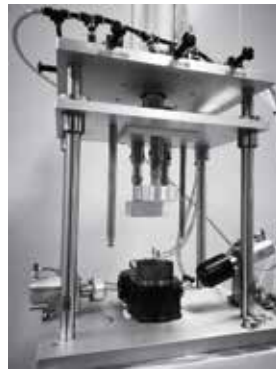
可定制集成夹具 Integrated sealing jigs can be customized.