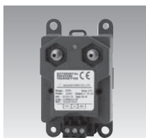
KL14 微差圧トランスミッタ