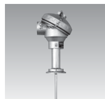
TH7□ 温度トランスミッタ