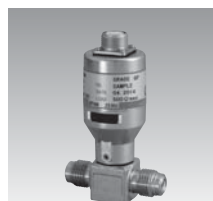
ZT15 圧力トランスミッタ