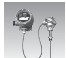
TH8□ 温度トランスミッタ